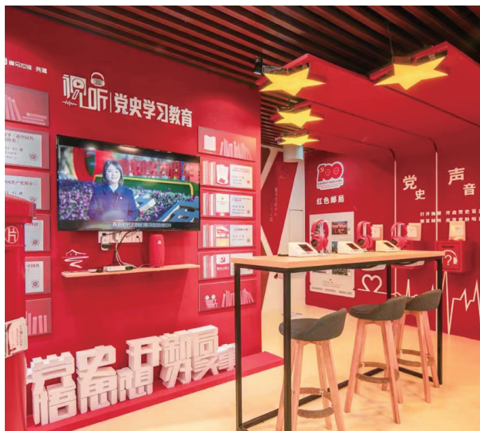
▲苏州“视·听”党史学习教育融媒平台

“阵地”是意识形态工作的根据地和桥头堡，是意识形态工作的重要依托和舞台。作为迈向信息网络服务全业务形态的国有大型文化企业，江苏有线以果敢的政治担当，坚守意识形态主阵地，打造智慧广电门户，坚持正面宣传，讲述好故事、传播好声音，让主流思想舆论牢牢占领宣传思想文化主阵地。第一，推动“壮大”主流传播阵地。打造“一镇一品”区域电视门户，实现直播、回看、点播内容融合推荐，让用户享受定制化、个性化、交互性节目内容。扩展宣传渠道，实现智慧广电平台与手机、电脑、户外大