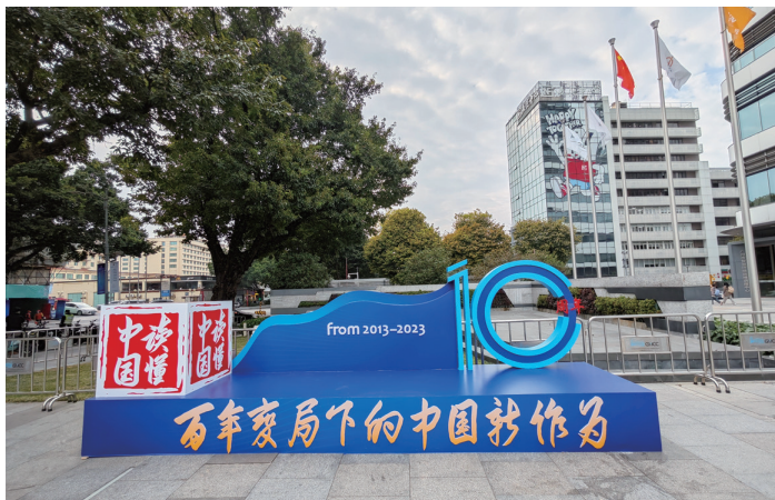
▲2023年“读懂中国”国际会议会场

中国式现代化体现科学社会主义的先进本质。中国式现代化坚持以人民为中心，强调在实现共同富裕、物质文明和精神文明相协调、人与自然和谐