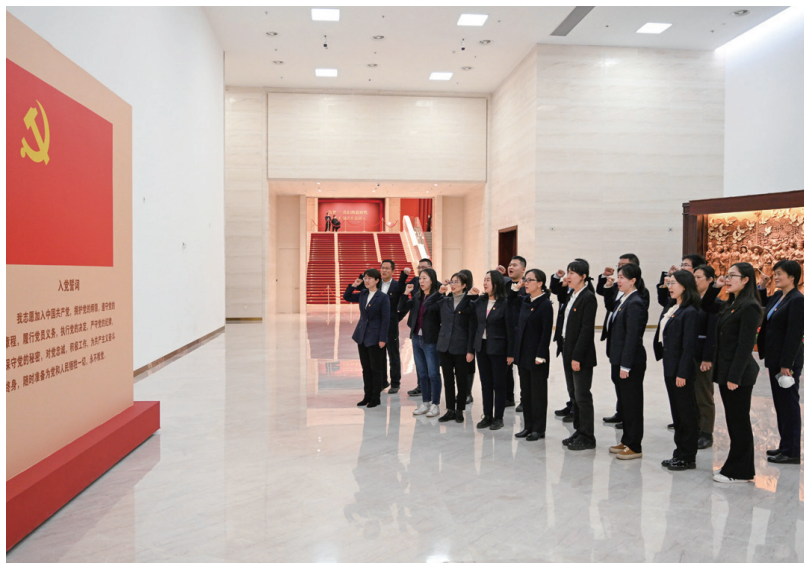
▲党员干部在中国共产党党史馆重温入党誓词

近年来，国网冀北电力有限公司物资分公司（以下简称“物资公司”）党委认真贯彻落实习近平总书记关于思想政治工作的重要论述精神，把思想政治工作融入中心工作、嵌入企业发展全过程，在思想教育、文化浸润、职工关怀、自身建设四个维度发力，充分发挥思想政治工作统一思想、凝聚共识、鼓舞斗志、团结奋斗的重要作用，为推动公司高质量发展提供强大思想保障和精神动力。