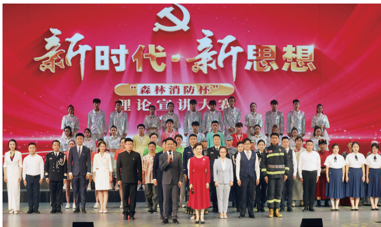
▲“新时代·新思想”“森林消防杯”理论宣讲大赛

“两新”组织等纳入宣讲范围，宣讲覆盖面不断拓展。持续举办“新时代·新思想”全省理论宣讲大赛，加快实施“一市州一品牌”工程。庆阳市、平凉市分别打造“理润庆阳”“溪河乡音”等宣讲品牌，广泛开展接地气的宣讲活动。