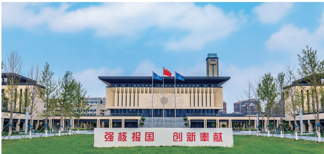
▲核工业学院天津校区

习近平文化思想是新时代党领导文化建设实践经验的理论总结，是习近平新时代中国特色社会主义思想的文化篇，在党的宣传思想文化事业发展史上具有里程碑意义。近年来，中核集团坚持以习近平新时代中国特色社会主义思想为指导，深入学习贯彻习近平文化思想，将这一重要思想贯彻落实到集团公司工作各方面，把思想伟力转化为推动核工业高质量发展的强劲动力。