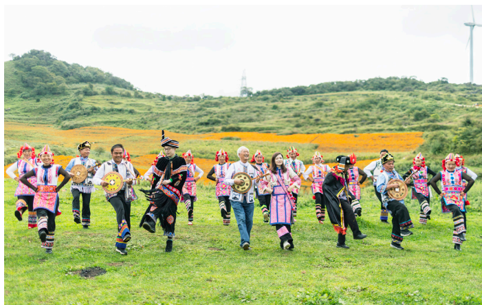
▲公司与云南省出水寨村结对开展文化扶助活动

公司党委以“践行初心、担当使命”要求为指引，坚守主业发展阵地，遵循上海市国资委“牢记使命、深化改革、守正创新、服务发展”的核心价值观，致力于让资本成为推动社会进步的力量。公司近五年利润总额124亿元，年人均创利1700万元。以“改革开放精神”为指引，做到五个“坚