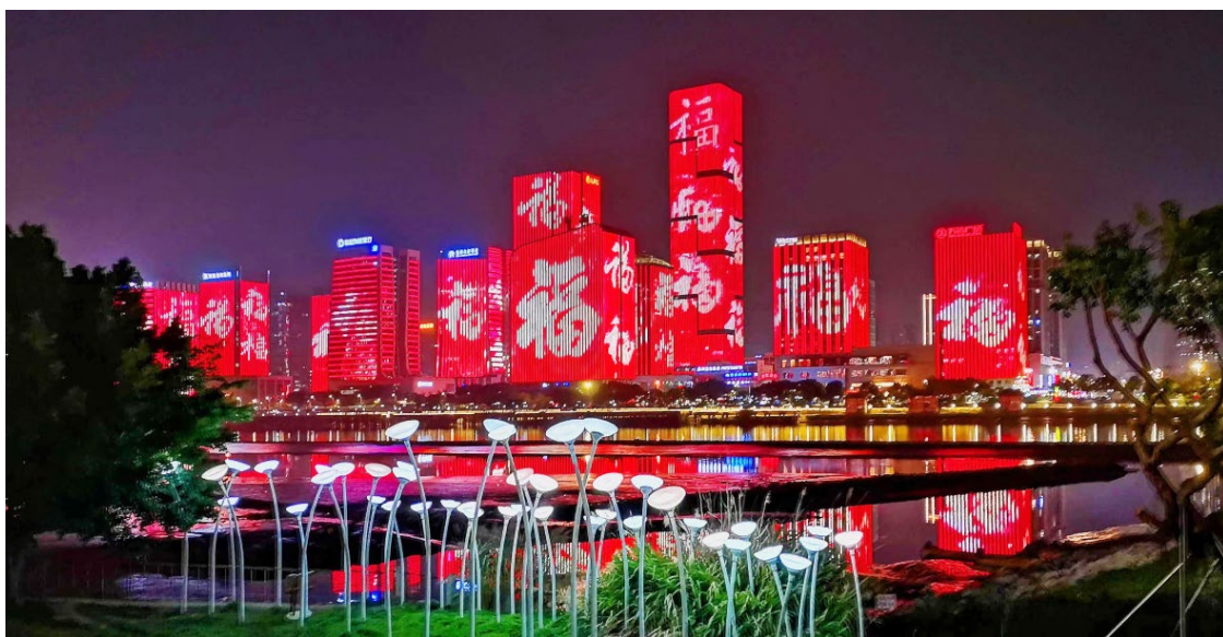
▲福州闽江两岸，“福”文化主题灯光秀精彩上演

党的十九大以来的五年，是党和国家发展进程中极不平凡的五年，也是宣传思想文化工作砥砺奋进的五年。五年来，福建坚持以习近平新时代中国特色社会主义思想为指导，深入学习贯彻习近平总书记关于宣传思想工作的重要思想，切实担当起举旗帜、聚民心、育新人、兴文化、展形象的使命任务，为奋力谱写全面建设社会主义现代化国家福建篇章提供坚强思想保证和强大精神力量。