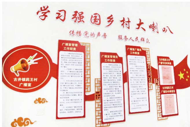
▲亳州市谯城区古井镇药王村广播室

自2020年1月24日起，在中宣部“学习强国”学习平台指导下，安徽省在全国率先试点“学习强国”乡村大喇叭建设。精选“学习强国”学习平台“听同期声”“新思想”“农民丰收”“听小喇叭”等栏目的优质内容制作成音频节目每日进行播放，让习近平总书记的声音传入安徽广大农村，为广大农民送去权威的理论知识、丰富的农技知识、科学的健康知识，为广大农村儿童播下知识的火种、点燃学习的热情，打通了“学习强国”学习平台服务“三农”工作的“最后一公里”。