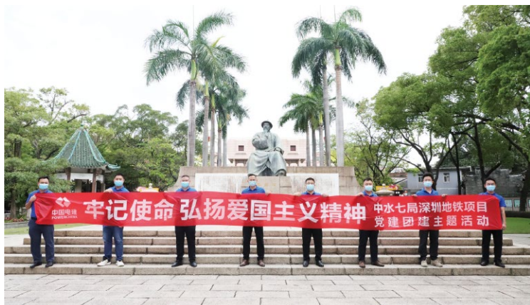
▲水电七局到红色教育基地开展党史学习教育

公司党委以服务基层、服务职工为落脚点与发力点，致力于让思政工作转化成“为群众办实事”的生动实践，让“红色细胞”融入公司每一个环节、每一个项目、每一个工程，以“小齿轮”的“微动力”增强“大引擎”的“硬核力”，铸强“红色引擎”。一是开展职工服务工作。印发《“我为群众办实事”项目清单》和《关于进一步深化党史学习教育“我为群众办实事”实践活动的通知》等文件，通过实地走访、召开座谈会、专题调研、网络征求意见等途径，共梳理“我为群众办实事”任务清单496项，目前完成85%。组织党员为身边群众办实事数量521个，组织党员干部参与志愿服务活动1283人次，帮扶生活困难职工986人次，服务养老、医疗、心理、生活便利受益8874人次。各相关部门制定措施，明确分管领导、责任部门和责任人持续推进，向基层一线延伸。二是开展志愿服务工作。公司党委建立起党员及青年志愿服务队、阳光文工团、“云服务”志愿者队伍等，开展各类志愿服务工作。面对河南极端暴雨和洪涝灾害，郑州