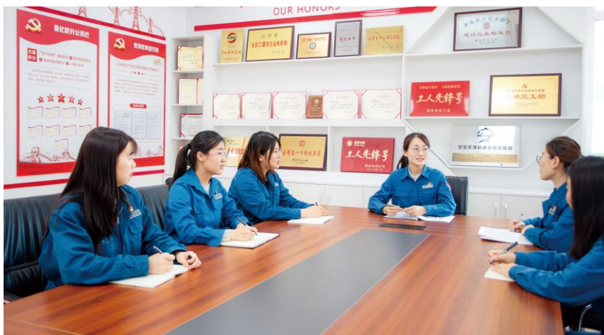
◀ 国网山东省电力公司青岛供电公司党支部书记开展定期谈心交流

针对员工承担重大任务、取得突出成绩、工作取得进步、岗位发生变动、生活遇到困难、存在负面情绪、出现工作过失等不同情况进行谈心谈话，帮助员工解除思想包袱、解决实际困难，增强企业向心力。例如，在开展“无投诉、降意见”工作过程中，分类制定了“定期谈心”“双向约谈”和“专题谈话”三项举措，通过“鼓励式”“疏导式”“诫勉式”谈心，帮助员工增强意识、提高技能、疏导情绪，查找问题、改进不足、优化服务。在员工出现操作违章时，以“帮”为出发点，用平和的心态而非问责的态度与他们进行面对面交流，对他们的思想和行为进行双重纠偏，帮助他们吸取教训、改正错误，振作精神、轻装前进。