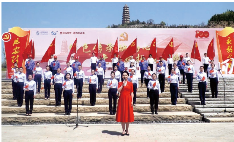
▲ “红色传承映初心、党旗飘扬在一线”接力活动

中国移动通信集团有限公司（以下简称“中国移动”）深入学习党的百年奋斗重大成就和历史经验，大力弘扬伟大建党精神，巩固拓展党史学习教育成果，依托网信技术优势，找准情感共鸣点、价值契合点、发展融合点，切实保护运用好红色资源，开展“5G赋能红色资源，为红色添亮色”系列活动，把推动党史学习教育常态化长效化同中心工作结合起来，把党史学习教育成效转化为奋进新征程、建功新时代的实际行动，喜迎党的二十大胜利召开。