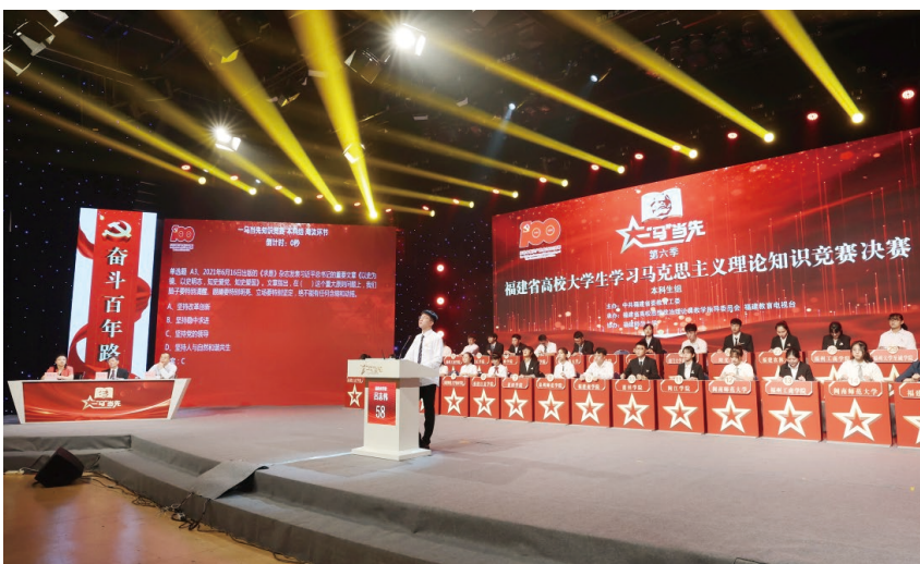
▲福建省高校大学生学习马克思主义理论知识竞赛决赛

福建省委、省政府高度重视高校思想政治工作，建立健全省领导进高校讲思政课的长效工作机制。2021年省委、省政府领导带动各级领导干部上思政课800多场次，有力推动各级部门和高校更加重视思政课建设。推动高校设立马克思主义理论类别，做到思政课教师高级专业技术职务（职称）岗位比例不低于学校平均水平。将思政工作纳入高校领导班子年度考核和政治巡视范围，写入学校综合办学实力评价、人才培养质量评价、文明校园考核等指标体系，在教学成果奖等评选中予以倾斜。统筹安排思政课教师教学补贴，在绩效工资总量内，分别按不高于年人均绩效工资总量1.5%、2.5%的标准统筹安排专职辅导员、专职思政课教师每人每月工作补贴，确保其收入不低于本校教师平均水平，推动大思政工作格局向着纵向衔接、横向贯通发展。以有力的措施落实落细各项保障工作，形成努力办好思政课、教师认真讲好思政课、学生积极学好思政课的良好氛围。