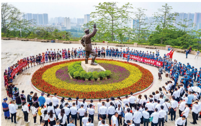
▲百色市右江区组织300多名入党积极分子开展“学史庆百年，永远跟党走”主题教育

中共中央办公厅印发的《关于推动党史学习教育常态化长效化的意见》（以下简称《意见》）强调，要用好革命遗址遗迹、纪念馆、博物馆等红色资源，发挥革命英烈、时代楷模示范引领作用，以重大节日和纪念日为契机开展主题活动，引导广大党员、干部深刻领悟中国共产党人精神谱系的丰富内涵和时代意义，传承红色基因，赓续红色血脉。百色市认真贯彻落实《意见》精神，健全完善红色资源开发保护和利用长效机制，发挥红色资源在党史学习教育、党性修