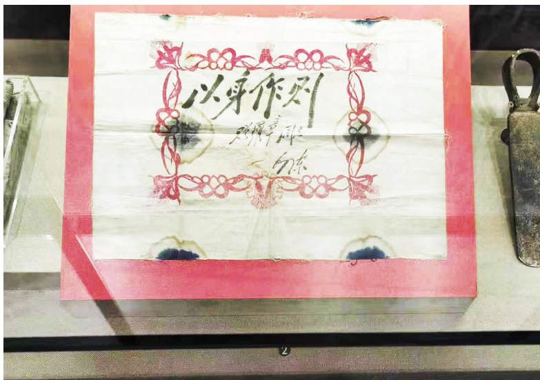
▲毛主席给罗章题字（原物）在中国人民革命军事博物馆展出