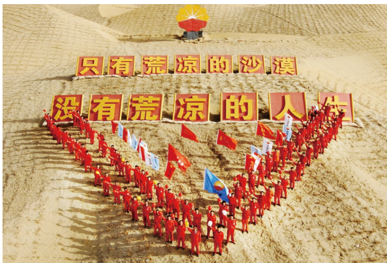
▲中国石油天然气集团有限公司新员工在“塔中沙海”开展入职教育

大庆精神主要内涵是“爱国、创业、求实、奉献”，铁人精神是大庆精神的人格化、具体化，大庆精神（铁人精神）的核心是“苦干实干”“三老四严”，其精要为“干”“实”“严”。新时代，是在党的领导下全国人民勠力同心、奋力实现中华民族伟大复兴中国梦的时代。中国石油必须加强大庆精神（铁人精神）专题研究，与创新理论武装结合、与弘扬中华优秀传统文化和伟大建党精神结合、与践行企业愿景和“我为祖国献石油”价值追求结合，立项开展系列研究课题，