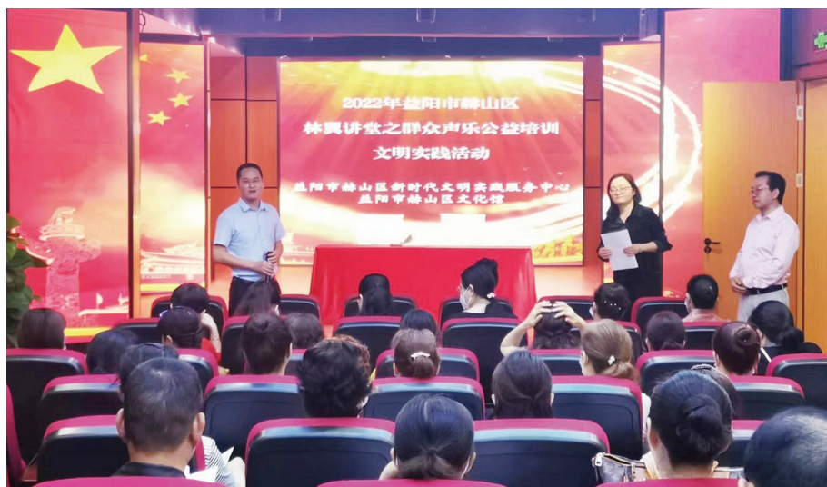
◀ 在新时代文明实践服务中心开展群众声乐公益培训文明实践活动

习近平总书记指出，推进新时代文明实践中心建设，不断提升人民思想觉悟、道德水准、文明素养和全社会文明程度。2019年被确定为全国新时代文明实践中心建设试点县（区）以来，湖南省益阳市赫山区紧扣“凝聚群众、引导群众，以文化人、成风化俗”目标定位，注重整合资源，抓实常态长效，精心打造志愿服务品牌，推进新时代文明实践浸润心扉、凝神聚魂。