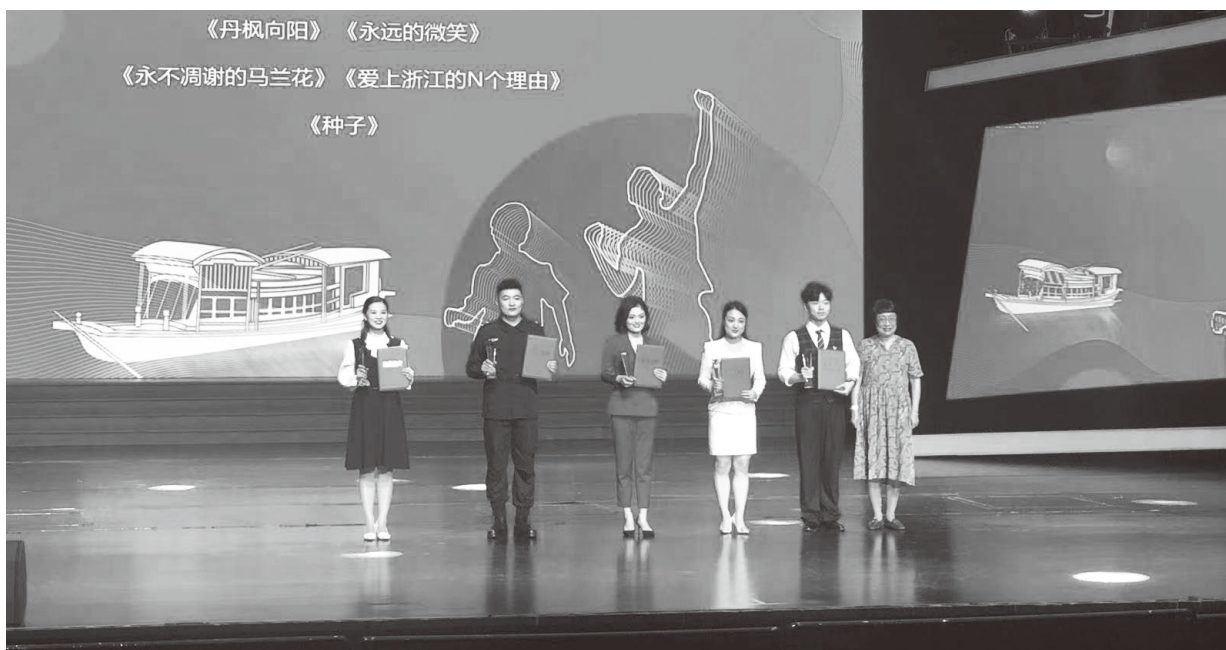
▲举办党的十九届六中全会精神青年理论宣讲大赛

党的十九届六中全会召开以来，宁波市委和全市各级党组织坚持把学习贯彻全会精神作为重大政治任务，认真落实中央和省委相关部署要求，第一时间第一议题学习，精心组织“六讲六做”大宣讲，掀起学习贯彻六中全会精神的热潮，引导广大党员干部群众争做“两个确立”的忠诚拥护者、“两个维护”的示范引领者，不断开辟干在实处、走在前列、勇立潮头新境界。