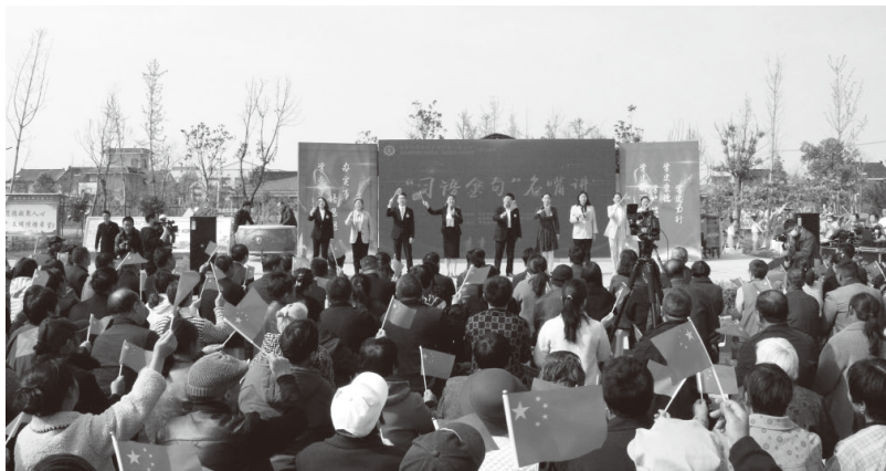
▲“理论集市 宣讲超市”推动党的创新理论“飞入寻常百姓家”

江苏省海安市以“123456”建设体系（即组建一支志愿队伍，回答“谁来做”的问题；统筹网上网下两个阵地，回答“如何实”的问题；实现三级全面覆盖，回答“做到哪”的问题；形成四化推进机制，回答“怎样做”的问题；打造五大服务平台，回答“怎么专”的问题；升格六类实践基地，回答“怎么创”的问题，致力打通宣传群众、教育群众、关心群众、服务群众的“最后一米”），围绕“传思想、做志愿、育文明”主题主线，推动文明实践工作“全线展开、全域覆盖、全面深化”，努力打造可操作、可推广的“海安样板”。