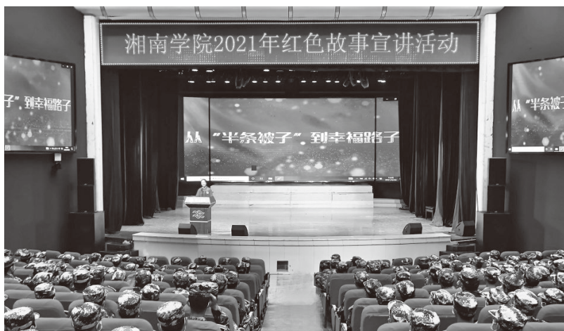
▲湘南学院举办红色故事宣讲活动

取郴州本土红色故事，接受红色教育。三是精心组织红色文化宣讲活动。依托党课、“开讲啦”“青年论坛”等平台，邀请校内外领导与专家学者围绕红色主题向师生宣讲50余场次。在全校遴选红色故事宣讲成员，成立红色故事宣讲团，深入班级、寝室、食堂等宣讲40余场次，构筑了一道靓丽的校园红色文化风景线。