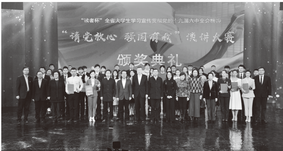
▲举办甘肃省大学生“请党放心·强国有我”演讲大赛

项事业发展的根本保障。只有坚决拥护“两个确立”、坚决做到“两个维护”，思想政治工作才能保证航向不偏、目标不移。