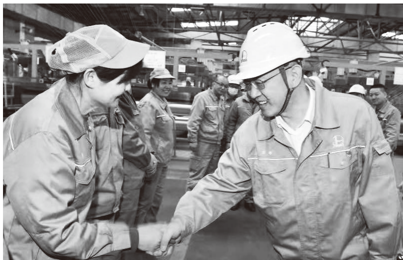
▲公司领导节日期间慰问一线职工

仪征化纤公司兴办于改革开放初期，20世纪80年代，其生产的化纤产品畅销国内市场。面对竞争日益激烈的市场环境，企业一度连年亏损、濒临困境。2017年，企业新任领导班子坚持以人民为中心，从强化思想政治工作入手解决发展困境，下大力气沟通聚民心、出实招暖人心、抓创新发展强信心，随行就市抓经营、大刀阔斧抓改革、科学规范抓管理，员工精神为之一振，企业面貌焕然一新，一举甩掉了亏损的帽子，连续4年保持盈利。问卷调查显示，员工对工作和生活满意率从2017年的58.92%上升到2020年的