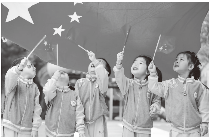
▲吉州区开展“童心向党”主题活动

习近平总书记指出：“要把红色资源运用好，把红色基因传承好，培养一茬茬、一代代合格的红军传人。”井冈山脚下的江西省吉安市吉州区在弘扬井冈山精神中坚持传承红色基因从娃娃抓起，探索出一条“日常+经常”行为养成、“教材+互动”立德铸魂、“融合+整合”情感培育、“队伍+实践”知行合一的红色基因传承模式，深播“红色种子”，引导青少年树立正确的世界观、人生观、价值观，让他们知史爱党、知史爱国。