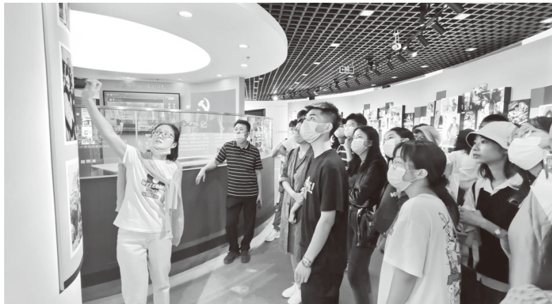
▲组织研究生参观“旗帜引领·光影华章——中国共产党领导下的中国电影发展历程展”

配备专职思政课教师，开展系统的马克思主义理论教育，及时组织学生深入学习习近平总书记最新重要讲话精神。开设《中国特色社会主义理论与实践》《自然辩证法》