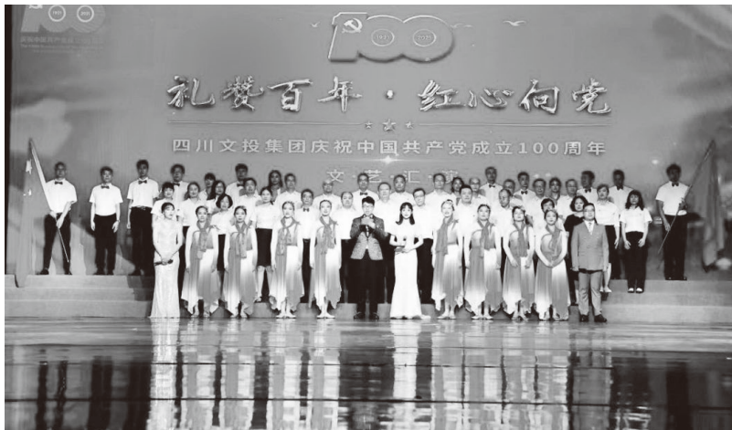
▲举办庆祝中国共产党成立100周年文艺汇演

抓教育培训，提升执行力。坚持每年对基层党支部书记进行培训，既安排党的政治理论与实践、党支部工作实务、党务工作者心理健康等内容学习，又组织到党建先进单位现场观摩、命题式案例培训等，开阔视野和启迪思路，解决思想认知这个源头活水。坚持开展基层党组织之间结对帮带和互学互帮活动，实现党支部间工作交流、补足短板，不断提升党支部书记抓党建基础、落实党建责任的能力。