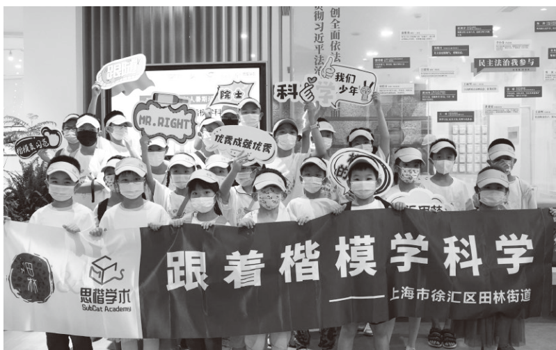
▲徐汇区田林街道组织青少年开展“跟着楷模学科学”活动

习近平总书记指出：“当今世界，信息技术创新日新月异，数字化、网络化、智能化深入发展，在推动经济社会发展、促进国家治理体系和治理能力现代化、满足人民日益增长的美好生活需要方面发挥着越来越重要的作用。”近年来，上海市紧紧抓住超大城市数字化转型的机遇，发挥全感知、全联接、全场景、全智能的数字化应用新优势，推动社区思想政治工作守正创新，取得较好成效。