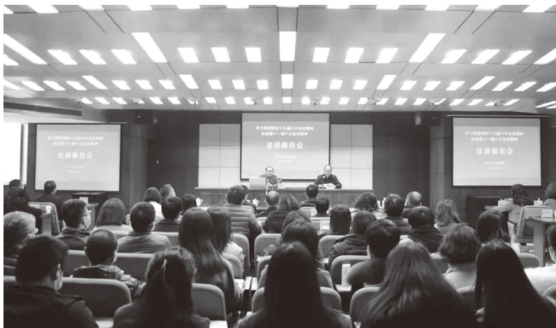
▲邀请专家宣讲党的十九届六中全会精神

党的十九届六中全会指出，全党必须铭记生于忧患、死于安乐，常怀远虑、居安思危，继续推进新时代党的建设新的伟大工程。党支部书记作为基层党组织的带头人，是抓好基层党组织建设、把党支部建设成坚强战斗堡垒的关键。我们应通过强化组织领导、教育培训、考核激励，切实增强基层党支部书记队伍建设。