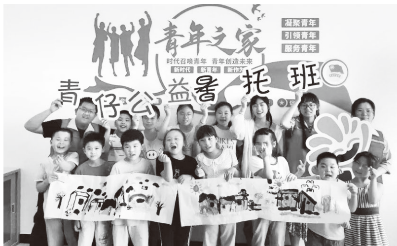
▲泰兴市张桥镇团委开展“青仔公益暑托班”活动

一是坚持在组织推动上不断发力。在原农村留守儿童关爱保护和困境儿童保障工作联席会议制度的基础上，成立以市政府主要负责人为主任、相关部门负责人为成员的未成年人保护委员会，逐级压实属地责任和部门监督指导责任，构建集校园管理、救助帮扶、心理健康、文化宣传、法治保障等内容为一体的未成年保护工作机制，确保未成年人依法得