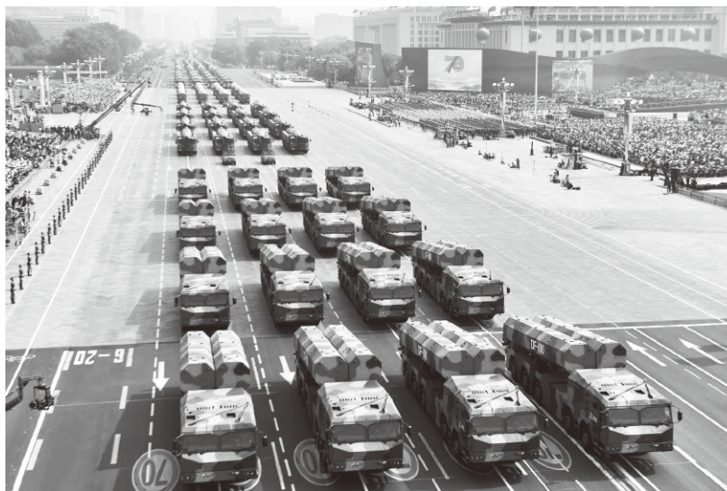
▲航天三院研制的大国重器在国庆70周年阅兵式上接受检阅

中国航天三院姓党，红色是中国飞航最鲜亮的底色。三院从诞生之日起，就天然烙印着姓党为党的独特属性，肩负强军报国的责任使命。作为航天强国建设和国防武器装备建设的主力军，姓党为党始终是飞航人的本色，红色基因始终是飞航事业的根脉。今天，我们继续用红色基因构建飞航人的精神图腾，引领飞航事业保持一往无前的动力、团结奋斗的内力、开新图强的定力，坚守初心、砥砺前行，朝着