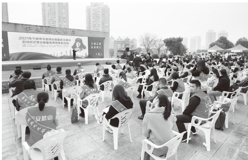
▲宁波市学雷锋志愿服务主题月启动仪式

深入实施理念普及行动。开展志愿服务理念普及“六进”活动，全方位强化教育引导、舆论宣传、文化熏陶、实践养成等工作，把志愿理念送进千家万