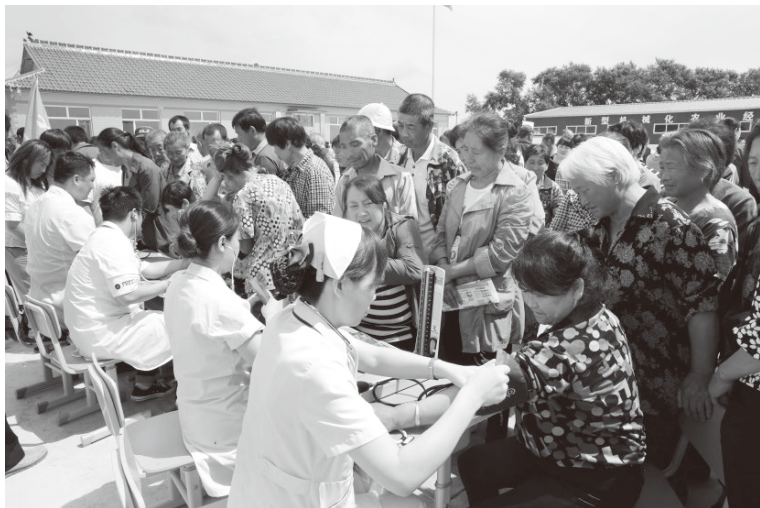
▲长春市开展健康送上门活动

为群众办实事是锤炼广大党员为民服务本领的“磨刀石”，也是检验广大党员初心使命的“试金石”，只有把老百姓的“难事”当作“要事”、把群众的“关注点”当作“着力点”，才