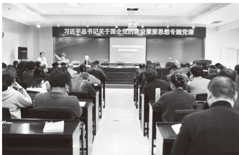
▲举行学习习近平总书记关于国企党的建设重要思想专题党课

制度的经济基础，改变长期贫困落后的面貌，国家建立和发展了一大批国营重点企业。从新中国成立初期到党的十一届三中全会前夕，短短几十年，我们国家就基本建成了较为完备的工业体系。国有企业作为“共和国长子”，为巩固新生的社会主义国家、提高人民群众生活水平发挥了不可替代的作用。作为思政工作者，我们要讲好国企故事，就要明确国有企业的初心和使命，讲好国企历史上的光荣传统，激发国企职工接续奋斗的热情。