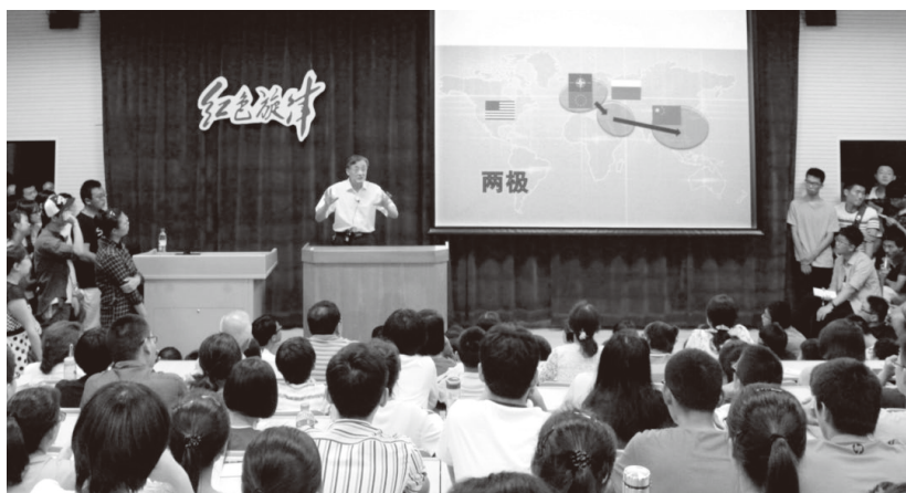
▲专家学者在“红色旋律”讲坛上为学生授课

燕山大学源于哈尔滨工业大学，前身为东北重型机械学院，受“工业救国”“教育兴国”使命感召，应国家重工业战略布局需要诞生，承“瘦而高”办学理念浸润，得黑土文化和燕赵文化滋养，经改革开放举校南迁洗礼，特别是学校“两次搬迁、三次创业、划转更名”，发展之路几多艰辛、饱含沧桑，一代代东重人和燕大人上下求索、不懈奋进，形成了燕山大学独特的文化品格：不畏艰难、自强不息的奋斗基因，严谨专注、精益求精的工匠精神，敢于创新、善于创造的卓越品质，心系祖国、服务社会的家国情怀。在这种文化品格的涵育、引领下，学校先后为国家培养了30余万优秀人才，创造了国内多项“首