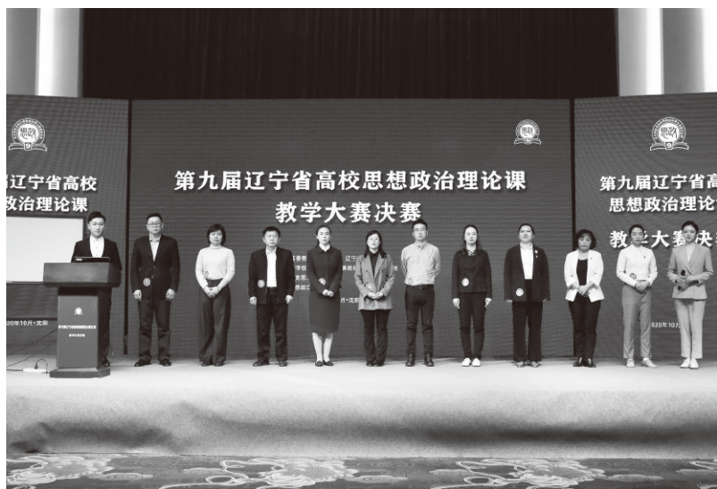
▲第九届辽宁省高校思想政治理论课教学大赛

辽宁拥有115所高校，思政课教师2500人。由于受到各个方面因素的影响，思政课教师曾一度短缺。为了全力解决思