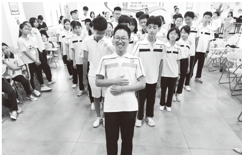
▲汕头市文明办举办志愿服务基地拓展活动

2020年新冠肺炎疫情防控期间，持续奋战在一线的医护人员和基层干部，在长期高压的工作环境下，容易产生剧烈情绪波动和巨大心理压力，而未成年人由于知识面相对狭窄、心理承受力较弱，更容易出现不同程度的烦躁、紧张、畏惧、焦虑、消沉等不良情绪综合征。及时引导群众尤其是未成年人消除恐慌心态，同步做好心理防“疫”，以积极心态直面疫情、理性应对，显得尤为重要。