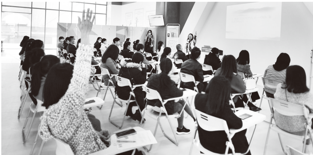
▲教师志愿者参加心理健康培训讲座