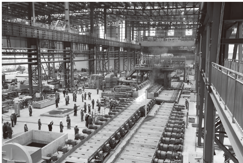
▲中国一重研制的国内首条重型H型轧机在马钢实现一次热负荷成功

把握构建新发展格局的战略构想和重要着力点，全力以赴建设世界一流企业，加快科技自立自强，向全球产业链与价值链中高端攀升。