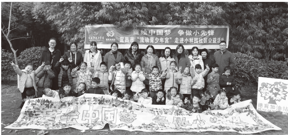
▲宜昌市“流动青少年宫”走进小林园社区开展公益活动

近年来，宜昌市立足《新时代公民道德建设实施纲要》的任务要求，充分整合各部门资源，探索在社区建设“德育加油站”，引导全市广大青少年树立远大志向，热爱党、热爱祖国、热爱人民，形成好思想、好品行、好习惯，扣好人生第一粒扣子。打造家庭、学校、政府、社会“四位一体”的未成年人思想道德建设工作平台，有力推进了全市未成年人思想道德建设。