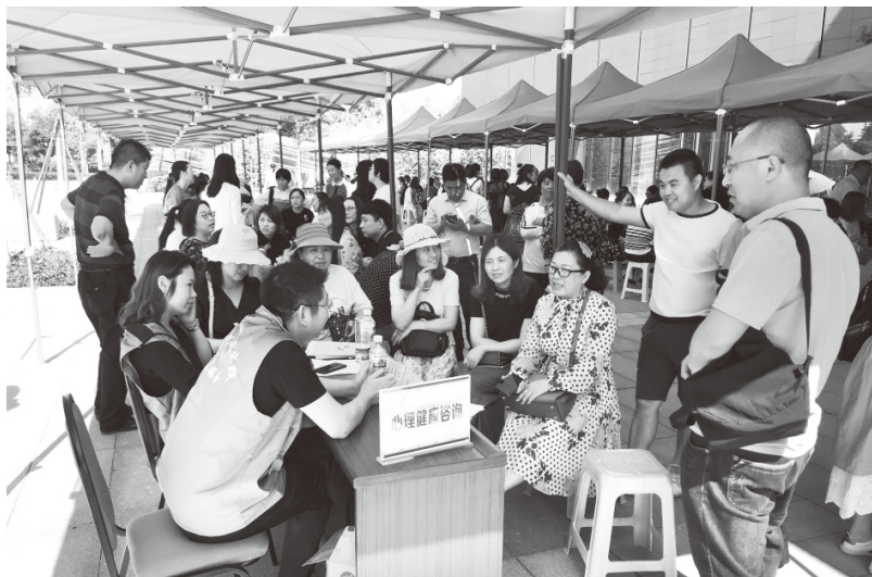
▲在“心理健康咨询大集”上，为家长解答孩子成长中遇到的心理难题

开展“家庭教育咨询大集活动”。以家庭教育为基础，将家庭教育理念宣传作为突破口，引导家校全方位合作。充分调研家长关注的教育热点问题，设置“学习态度与动机”“青春期教育”“人际交往”等13类问题，设立专家咨询“摊位”，为家长提供“面对面”咨询服务。目