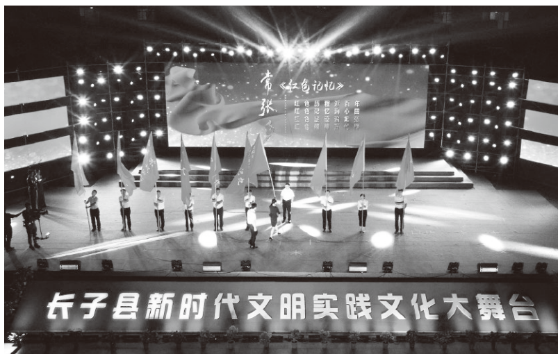
▲长子县新时代文明实践文化大舞台

习近平新时代中国特色社会主义思想是全党全国人民的思想旗帜和精神旗帜，是推动新时代