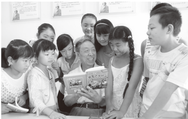
▲“五老”志愿者给社区的孩子们讲故事

发动社区志愿者。动员社区“格格”、劳模标兵、专业能人、身边好人等组建“社区德育校外辅导员”志愿服务队，利用周末和寒暑假向孩子们讲述红色故事、普及科技知识、介绍生活常识，受到孩子们的热烈欢迎。结合我市党员干部“双报道、双报告”活动，组织机关干部中的“爱心人士”和社区10名单亲家庭孩子结成对子，陪他们阅读、看电影、参加趣味运动会，带来“妈妈般”温暖。吸纳“三峡蚁工”“稻草圈圈”“航运妈妈”“宜昌心理疏导服务队”等社会志愿服务组织广泛参与其中，帮助未成年人扣好人生第一粒扣子，让志愿