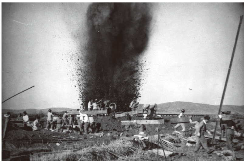
▲抗美援朝战场上，铁道兵指战员不顾定时弹爆炸坚持抢修

1978年，铁道兵成立30周年，叶剑英元帅题词称赞：“逢山凿路，遇水架桥，铁道兵前无险阻；风餐露宿，沐雨栉风，铁道兵前无困难”，它是铁道兵战斗生活的真实写照，也是铁道兵精神的高度凝