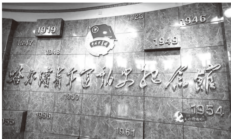
▲黑龙江开展“百名主播讲党史”活动

黑龙江省在党史学习教育中着力用好红色资源，紧扣中国共产党百年奋斗历程、党在龙江的浴血奋战史、艰苦创业史、改革创新史，大力弘扬东北抗联精神、北大荒精神、大庆精神、铁人精神等龙江优秀红色精神，上好社会“大思政课”，继承发扬革命传统，激发党员干部群众的奋进力量，信心百倍为全面建设社会主义现代化新龙江、实现中华民族伟大复兴中国梦而奋斗。