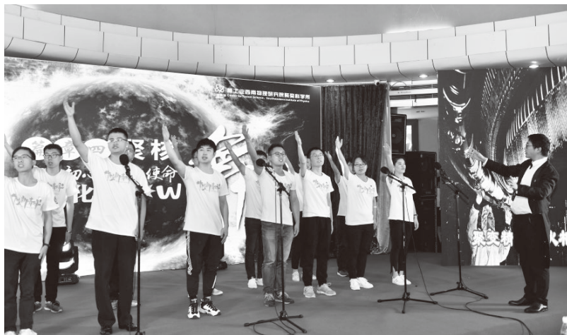
▲主题党日活动——核的传人