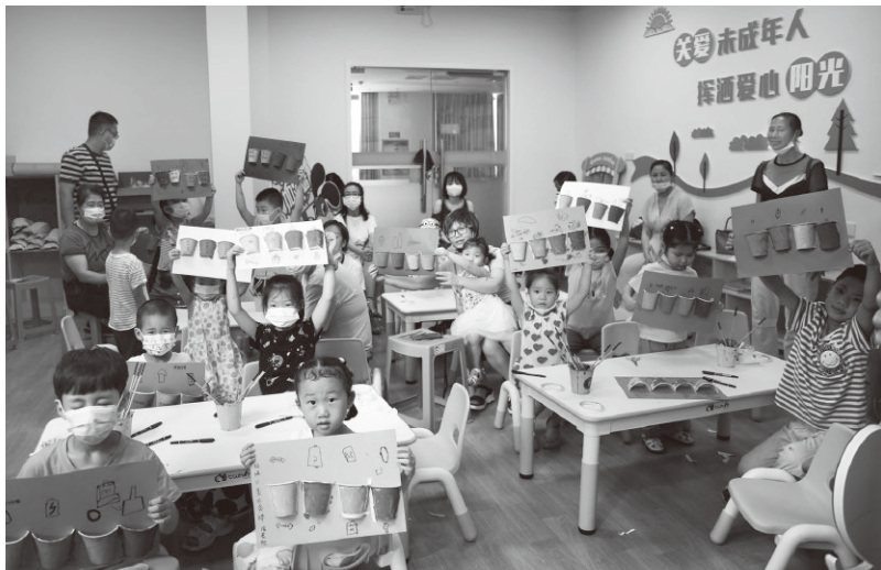
▲锦绣社区七色花“德育加油站”教育引导少年儿童参与垃圾分类

丰富主题实践活动。采用请进来与走出去相结合、讲故事与微实践相结合等方式，广泛开展“我是社区小主人”“红领巾课堂”“生态小公民”“安全伴我行”“模拟法庭”“爱心小课桌”等系列主题实践活动，不断