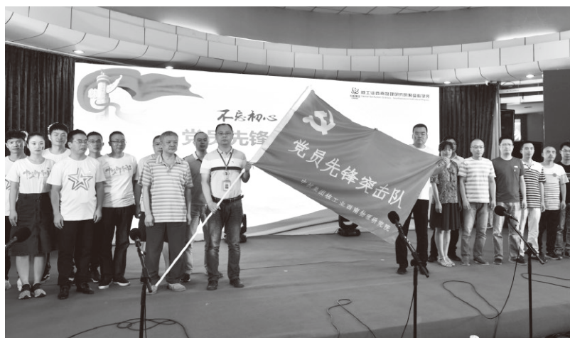
▲为党员先锋突击队授旗

高举马克思主义、中国特色社会主义伟大旗帜，坚持以习近平新时代中国特色社会主义思想为指导，切实做到以党的旗帜为旗帜、以党的方向为方向。第二，唱响主旋律，壮大主流思想。提高政治站位，坚持把思想政治工作纳入重要议事日程，纳入意识形态工作责任制，着力加强意识形态工作领导权和主动权。加强传播手段和话语方式创新，精心设置议题、主动引导话题，把握正确舆论导向。第三，加强教育引导，统一思想认识。把学习同研究解决企业改革发展和党的建设重大理论和实践问题结合起