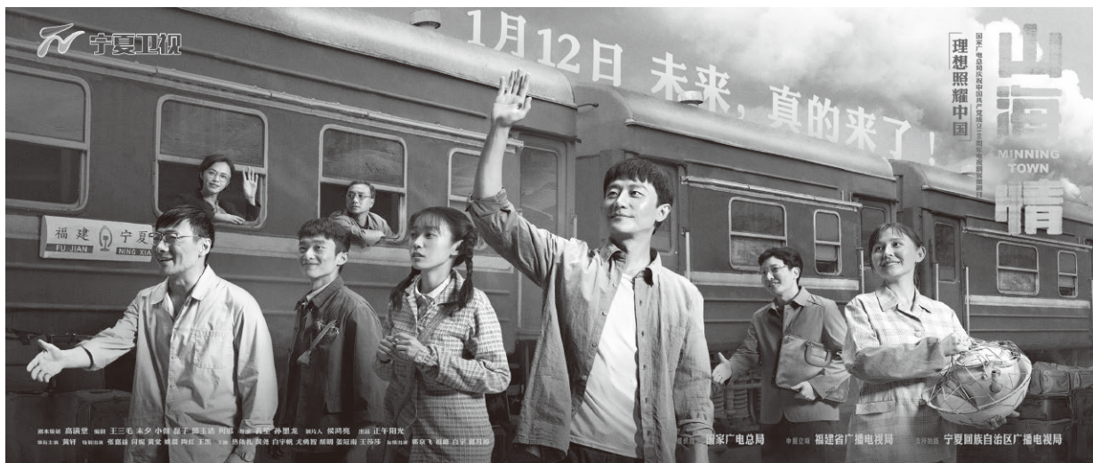
▲电视剧《山海情》海报