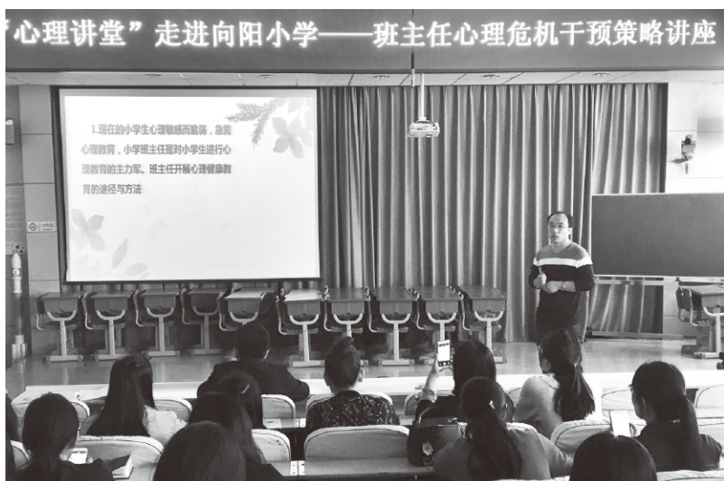
▲开展“心理讲堂进校园”活动，为班主任教师进行工作培训

建立全学段工作机制。完善心理健康教育辅导市级总站、中学（小学）分站、校级心理咨询室三级心理健康教育辅导阵地，构建起市级总站统筹协调、中学（小学）分站分类指导、校级心理咨询室有序推进的工作机制，全市共建有小学心理辅导站73个、中学心理辅导站33个，实现全学