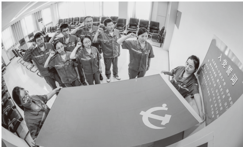
▲中国中车启动高铁先锋工程，打造党建“金名片”

体表现为中国中车听党话、跟党走和坚持服务人民。它体现的是中车红色基因中最本色的成分。从新民主主义革命时期深深烙下红色印记、孕育红色基因，到社会主义革命和建设时期自力更生、艰苦奋斗，再到改革开放新时期以来自立自强、自主创新，中国中车都始终牢牢坚持党性和人民性原则。早期革命时期，中国中车诞生了多个地方的第一个党支部、第一个工会组织、第一个共产党员，还产生了王荷波、邓培、孙云鹏、林祥谦等中国共产党早期领导人和工人运动领袖，成为早期党组织传播马列主义、播撒革命火种、领导工人运动的重要阵地，形成了“听党话、跟党走”的鲜明品格。进入