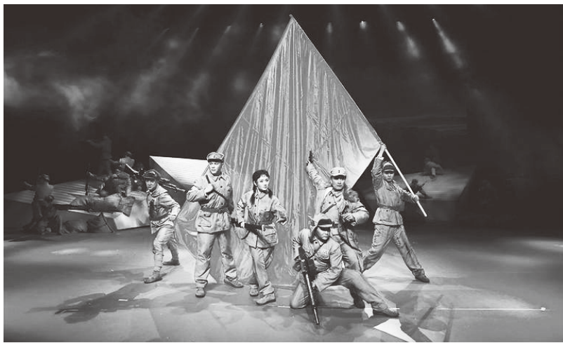
▲龙江剧《木兰马旭》在哈尔滨上演