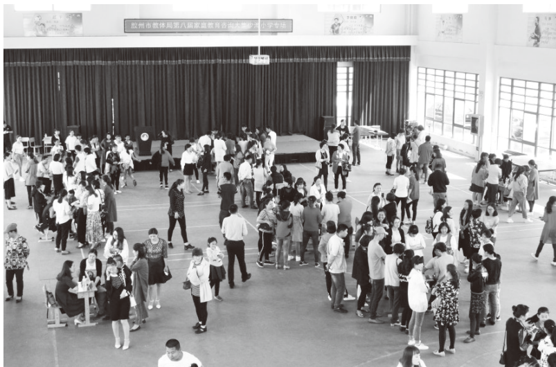
▲胶州市教体局举办家庭教育咨询大集

抓牢核心，加强班主任教师心理实务培训。班主任作为心理健康教育队伍中的核心，在准确