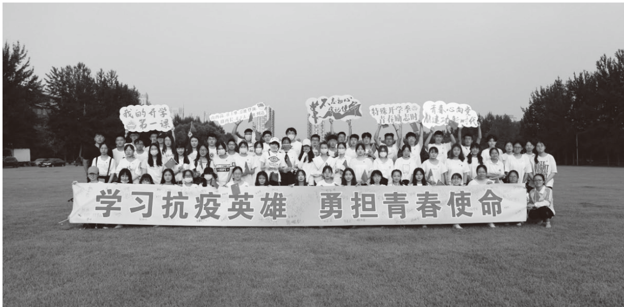
▲为学生们讲好抗疫“大思政课”

和力。要把提高高校思政课质量和效果摆在突出位置，需要思政课教学实现从课堂内容的与时俱进到教学方法的创新发展。在统筹思政课一体化建设，推动思政课建设内涵式发展的基础上，高校党委可以通过各种措施引导教师充分挖掘学科蕴含的思想政治教育资源，有效融合思政课和其他专业课程，将立德树人贯穿高校教育教学始终。高校党委在推动思政课程改革上要发挥引领作用，为高校思想政治工作面临的新情况、新问题寻找有效解决途径，真正把思政课建设成学生真心喜爱、终身受益的优秀课程。