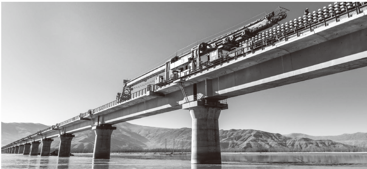
▲中国铁建承建的川藏铁路拉林段第一座跨雅鲁藏布江大桥——贡嘎雅鲁藏布江特大桥铺轨

桥”固定为企业精神，还将其融入企业使命、愿景、价值观、行为总则和一系列管理理念中，进一步从顶层设计上确立了铁道兵精神在中国铁建文化体系中的核心地位，为全系统企业文化指明了中长期建设方向。