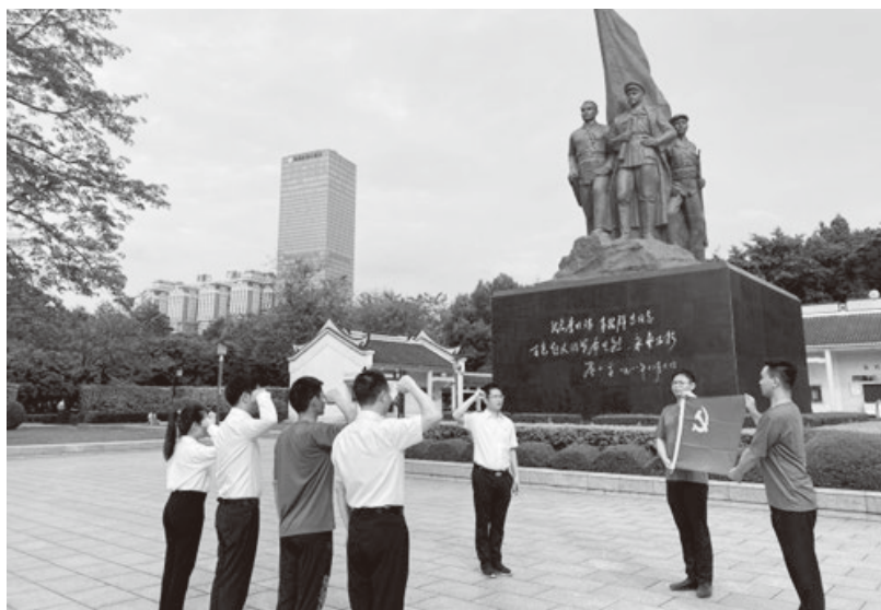
▲融通地产广西公司在革命先烈雕像前重温入党誓词