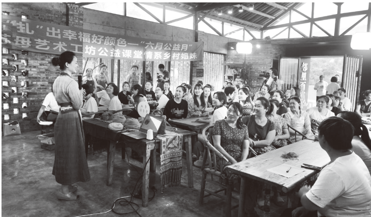
▲青神县高台镇开展“扎”出幸福好颜色——“六月公益月”活动