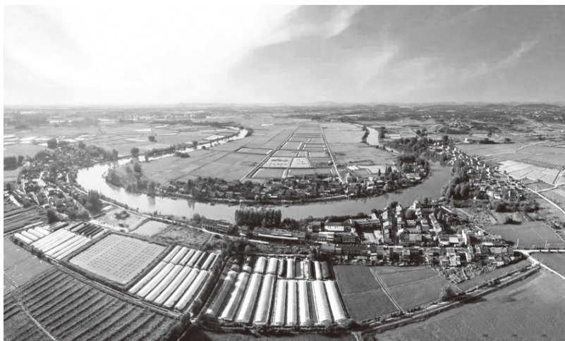
▲武汉江夏田园风光

江夏区地处平原和丘陵过渡地带，濒临长江，湖泊众多，依山傍水，植被丰富。区内有大小湖泊22个，湖泊水域面积约占武汉市的一半，排名全市第一。在治理湖泊水环境方面，创新打造河湖长制升级版，健全“区-街-村”三级河湖长制体系，30位区领导分别担当全区22个湖泊、8条省管河流的区级河湖长。同时，深化河湖长制考