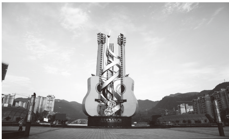
▲正安县吉他文化广场

正安与吉他的结缘，要追溯到1987年，原正安县劳动服务公司与当时的广东省番禺县签订了300名女青年到该县企业当工人的合同，组织了第一批南下打工大军，开创了贵州省有领导、有规模、有组织地向经济发达地区输出富余劳动力的先河。《人民日报》刊发了《正安300娘子“出师”广东番禺》的消息。消息发出后，正安县敢为人先的举动在全国引起强烈反响。