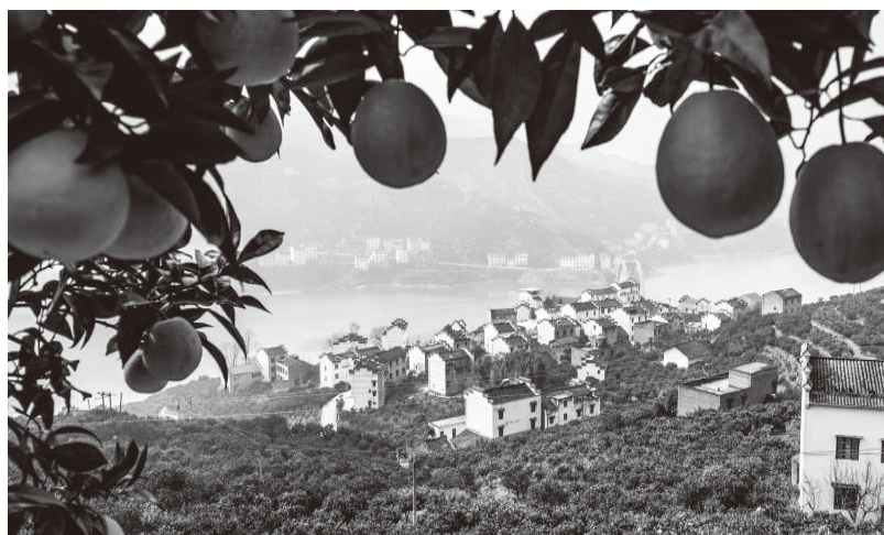
▲烟灯堡村脐橙产业核心示范园

湖北省秭归县郭家坝镇烟灯堡村地处长江西陵峡南岸，共有626户、2085人。全村深入践行“绿水青山就是金山银山”理念，发展脐橙产业富民兴村，成为三峡库区远近闻名的脐橙专业村，脐橙种植面积3300亩，2019年脐橙总产量4900吨，橙农户均收入超过10万元，农村经济收入3128万元，先后荣获“湖北省宜居村庄”“宜昌市生态村”“宜昌市美丽乡村30强”等殊荣。烟灯堡村的美丽嬗变成为三峡库区40多年脐橙产业发展史的生动缩影。