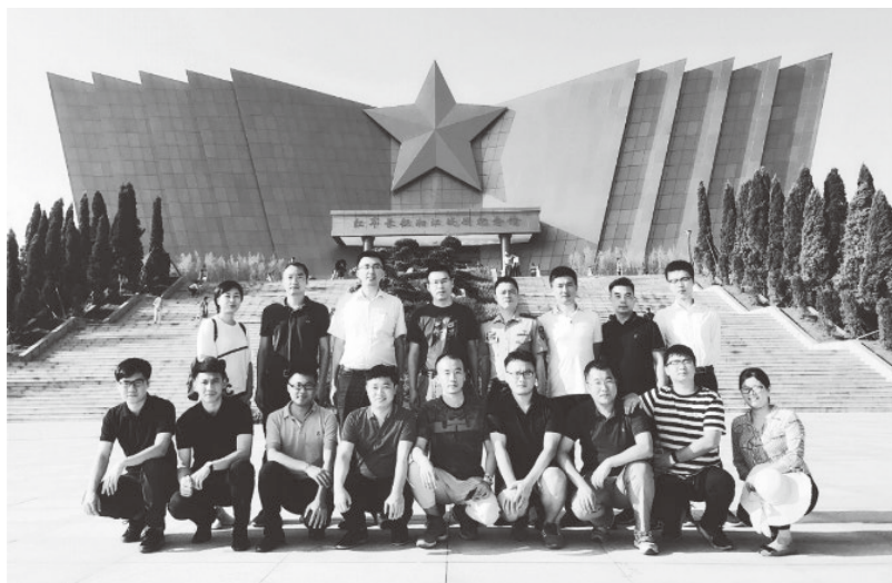
▲融通农发公司赴红军长征湘江战役纪念馆开展革命传统教育

一年多来，坚持与旗帜同行、与时代同频、与使命同向，积极履行社会责任。在抗疫大考中第一时间组织武汉地区32家酒店提供7347间客房，为11支军地援鄂医疗队6338名