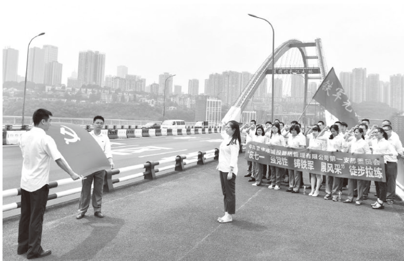
▲城投路桥第一支部开展“庆七一 强党性 铸铁军 展风采”徒步拉练

“不忘初心,方得始终。”做好思想政治工作,“守正”是基础。公司坚持用习近平新时代中国特色社会主义思想武装头脑、指导工作,增强“四个意识”、坚定“四个自信”、做到“两个维护”,全面贯彻落习近平总书对重庆提出的“两点”定位、“两地”“两高”目标、