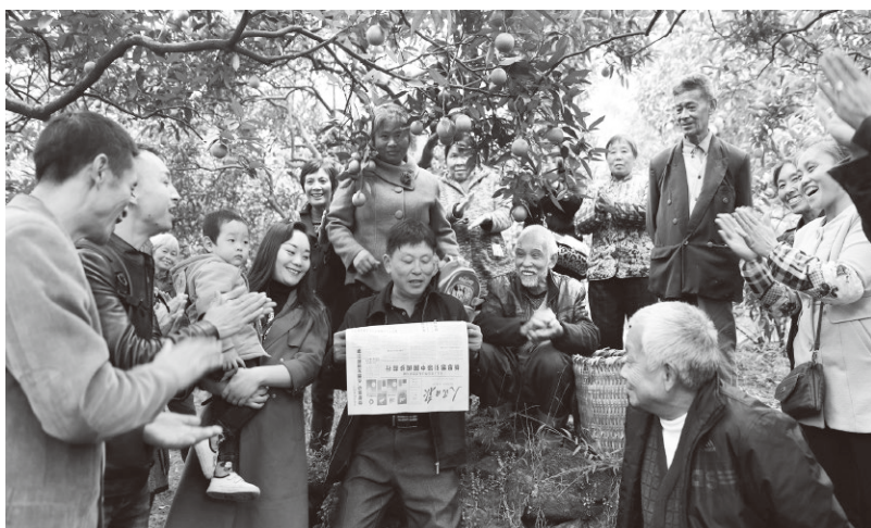
▲华蓥市庆华镇邱家嘴村干部向果农宣传脱贫致富政策

充分发挥党委领导关键作用。严格落实“五级书记遍访贫困对象”要求，出台《市委常委“六个一”行动方案》，党委主要领导一线调研、一线解决问题、一线推动工作，汇