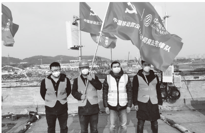
▲2020年春节期间，武汉分公司党员突击队奋战疫情防控最前线

中国移动通信集团有限公司党组紧紧围绕2020年是全面建成小康社会的决胜之年，是集团公司成立20周年这一时间节点和契机，在提高政治站位、强化思想引领、坚定初心使命、凝聚奋进力量上出实招、求实效，团结带领全体党员干部员工不忘初心、牢记使命、持续奋斗，筑牢中国移动“力量大厦”，促进公司高质量发展，为实现“两个一百年”奋斗目标和中华民族伟大复兴的中国梦贡献更大力量。