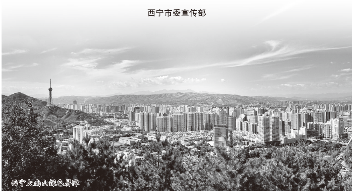
西宁大南山绿色屏障

西宁市委市政府坚持以习近平生态文明思想为指引，践行“四个扎扎实实”重大要求，全面实施“绿色人文”建设行动，推动习近平生态文明思想入脑入心入行，形成了崇尚绿色发展的浓厚社会氛围。在绿色发展理念的引领下，市委市政府顺应人民群众对清新空气、清澈水质、清洁环境等生态产品的新期待，全面实施“高原绿”“西宁蓝”“河湖清”建设行动，高原生态山水城市初具雏形，天水一色、绿意盎然、鸟语花香的生态画卷徐徐展开，全市人民的生产生活正向高质量高品质逐步迈进，人民群众获得感、幸福感、安全