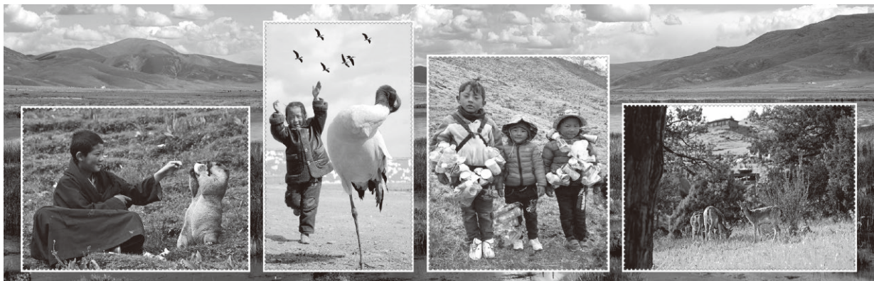
▲玉树生态文明成果