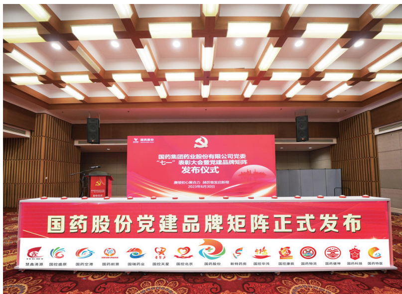
▲2023年6月30日，国药股份党建品牌矩阵正式发布

完善管理机制。按照“分级管理、逐级负责”原则，国药股份构建了“纵到底、横到边、全覆盖”的网格化思政管理体系。基层党委作为网格化管理的“总指挥”，履行领导责任；政工部门作为网格化管理的“推动者”，做好组织推广；基层党支部作为网格化管理的具体“执行者”，负责具体实施。各级党组织上下联动、齐抓共管，加强对思想政治工作的领导和组织，层层有责任、层层有抓