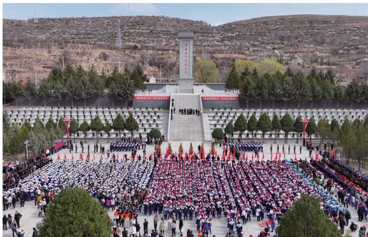
▲固原二中和弘文中学连续29年开展祭英烈活动

坚持正确政治方向、舆论导向，着力统一思想、鼓舞斗志、汇聚力量。一是壮大主流舆论。把思想政治工作融入主题宣传、形势宣传、政策宣传、成就宣传、典型宣传当中，大力宣传黄河流域生态保护和高质量发展先行区建设进展，讲