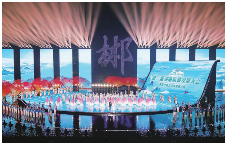
▲第二届湖南省旅游发展大会开幕式暨文化旅游推介会在郴州市举行

深入开展专题调研，全面梳理当前工作中存在的问题，抓短板弱项、抓重点难点、抓督查督导，以文明创建持续增强人民群众的幸福感和获得感，不断释放精神文明建设的“红利”。创新开展“和美”小区创建活动，按照“四和四美”要求，成功打造“和美”小区50个。目前全市9个县市全部获得省级文明城市称号，获评全国文明单位19个、全国文明村镇25个、全国文明家庭2户、全国最美家庭22户。