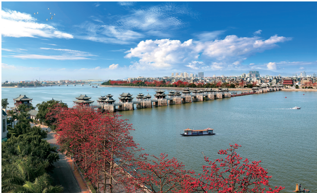
▲潮州古城东门外的广济桥横跨韩江两岸

“秀岭如屏耀明珠，一江带水安北郭。”作为历代郡治所在地，潮州古城在千年的历史流变中，留存下广济桥、广济楼、牌坊街等大量历史遗珍。访古桥、赏非遗，登古楼、望美景，逛古街、看牌坊，潮州古城的独特气质吸引了一批又一批海内外人士。