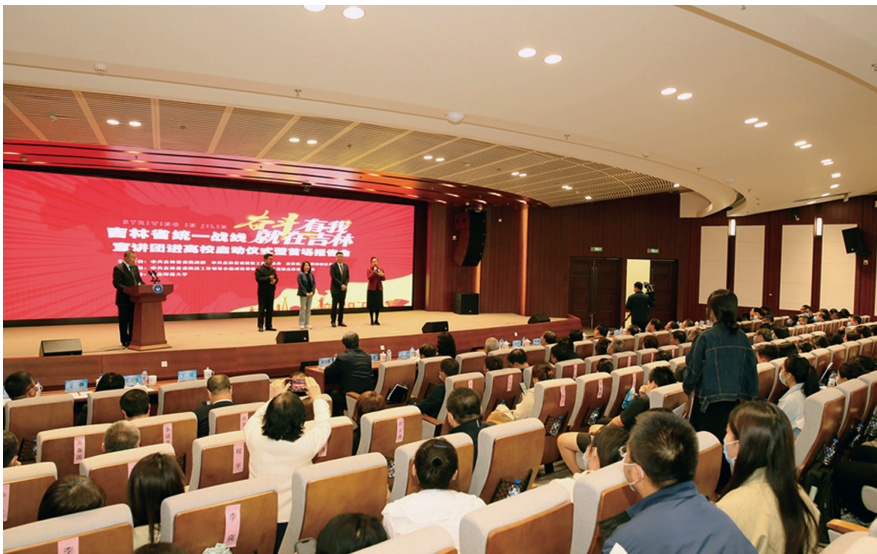
▲2023年5月，吉林省委统战部在东北师范大学开展“奋斗有我 就在吉林”宣讲报告会

聚焦团结奋斗的时代要求，打造思想政治引领新平台。 习近平总书记强调：“守正才能不迷失方向、不犯颠覆性错误，创新才能把握时代、引领时代。”宣讲工作是统战工作服务中心大局、开展思想政治引领和培养党外代表人士的一种创新形式。吉林省委统战部以“组织起来、行动起来、活跃起来、奉献起来”为目标，按照“五有”（有意愿、有时间、有能力、有代表性、有热情）标准，在全省优选80名政治素质高、创新创业经验丰富、事迹突出影响力强的统一战线各领域代表人士组成宣讲团。立足“学、严、实”三字方针，在建强宣讲队伍中不断增强思想政治工作实效。一是在“学”字上下功夫。组织开展集中研讨会、集中备课会，深入学习党