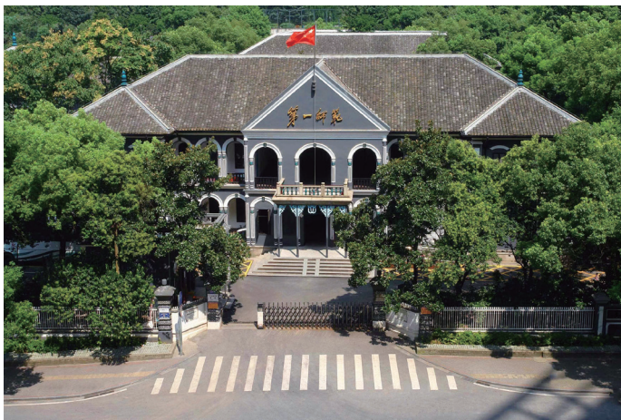
▲湖南省立第一师范学校旧址

以“红色师魂”的火种塑高尚品格。湖南一师承继早期以德为本、“德智体”三育并重的教学理念，教育学生筑牢社会主义核心价值观，树立教书育人、报国强国的远大志向，走出了以“大思政”育“大先生”、以“红色校史”铸“红色师魂”的育人新路。挖掘红色校史中的思政元素，发挥“大先生”的典范作用，开设《毛泽东与第一师范》《湖南一师早期先生群体》《毛泽东诗词选读》《第一师范与中国共产党的创建》《湖南一师早期学生群体》等校本课程，编写“永远的先生”等100个红色一师故事，以徐特立、杨昌济、孔昭绶等学校早期“大先生”群体的大师风范教育激励学生。培养学生的思政育人意识，在《小学语文教学设计》等专业课程中