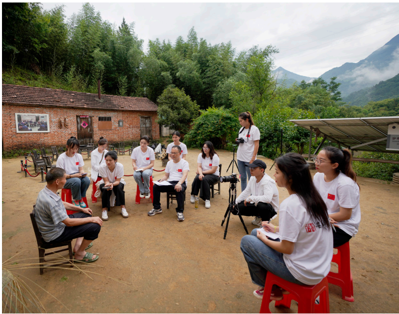
▲2022年“光辉的足迹”艺术思政课，师生去大湾村采风

近年来，安徽艺术学院（以下简称“学院”）认真贯彻落实习近平总书记在学校思想政治理论课教师座谈会上的重要讲话精神，落实立德树人根本任务，发挥综合类艺术院校艺术专业门类齐全的优势，结合艺术类学生特点，“向改革创新要活力”，逐步探索并形成了艺“讲”思政教学模式，有效提升思政课铸魂育人实效。2023年，学院的思政教学改革入选安徽省首批高校思政优秀教学方法，获批安徽省高校“三全育人”综合改革和思想政治能力提升计划；教改实践被多家中央媒体报道。学生获得全国